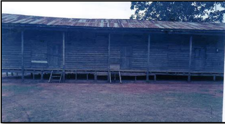
ဇန်တလန်(ခ)ကျေးရွာ အခြေခံပညာအလယ်တန်းကျောင်း(Back Side)မှ မြင်ကွင်းပုံ (ဗ-၁)