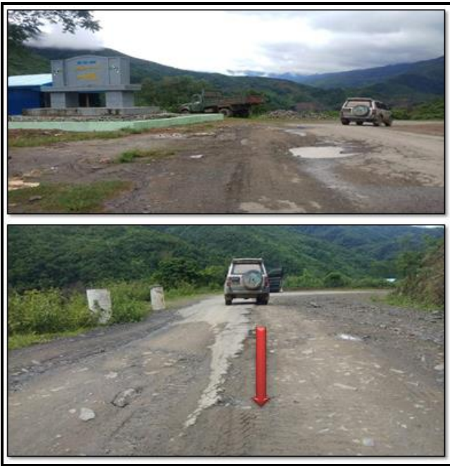
မင်းတပ်-မတူပီ ခရိုင်ချင်းဆက်လမ်း ကွင်းဆင်းမှတ်တမ်း မြင်ကွင်းပုံ (c-၁)