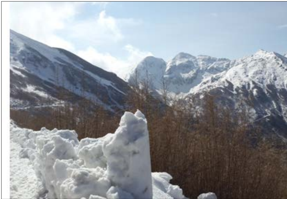
တောင်ကတုံးပုံများနှင့် မြေပြိုကမ်းပြိုသည့်နေရာများ မြင်ကွင်းပုံ (ဇ-၂)