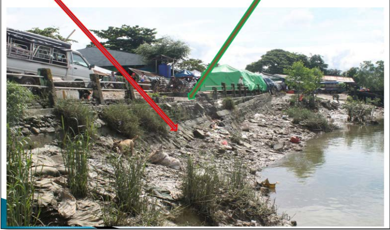
ပြိုမကျစေရန် ဒေါက်နဲ့ကန်ထားသော မြင်ကွင်းပုံ (ဆ-၂)