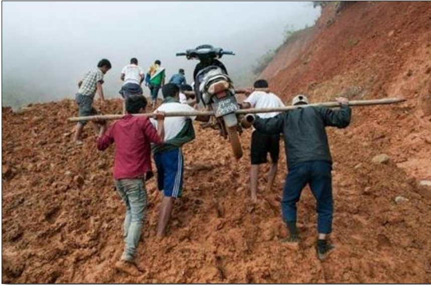
ဒေသခံများ ခက်ခဲစွာ ခရီးသွားလာနေရသော မြင်ကွင်းပုံ (၃-၁)