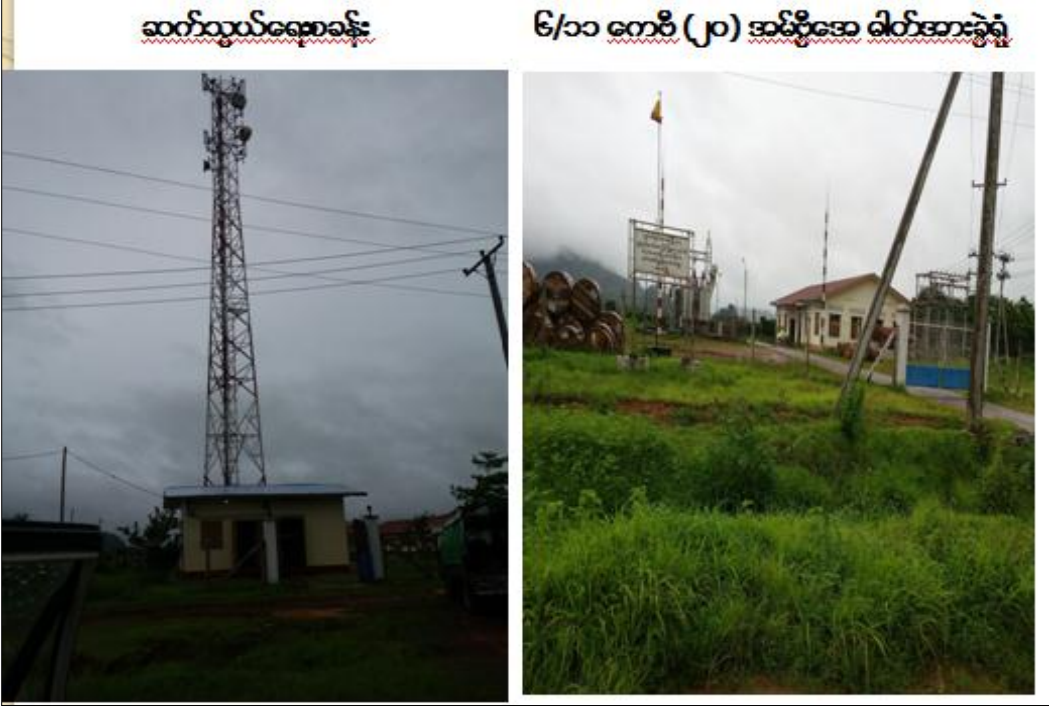
ဆက်သွယ်ရေးစခန်း