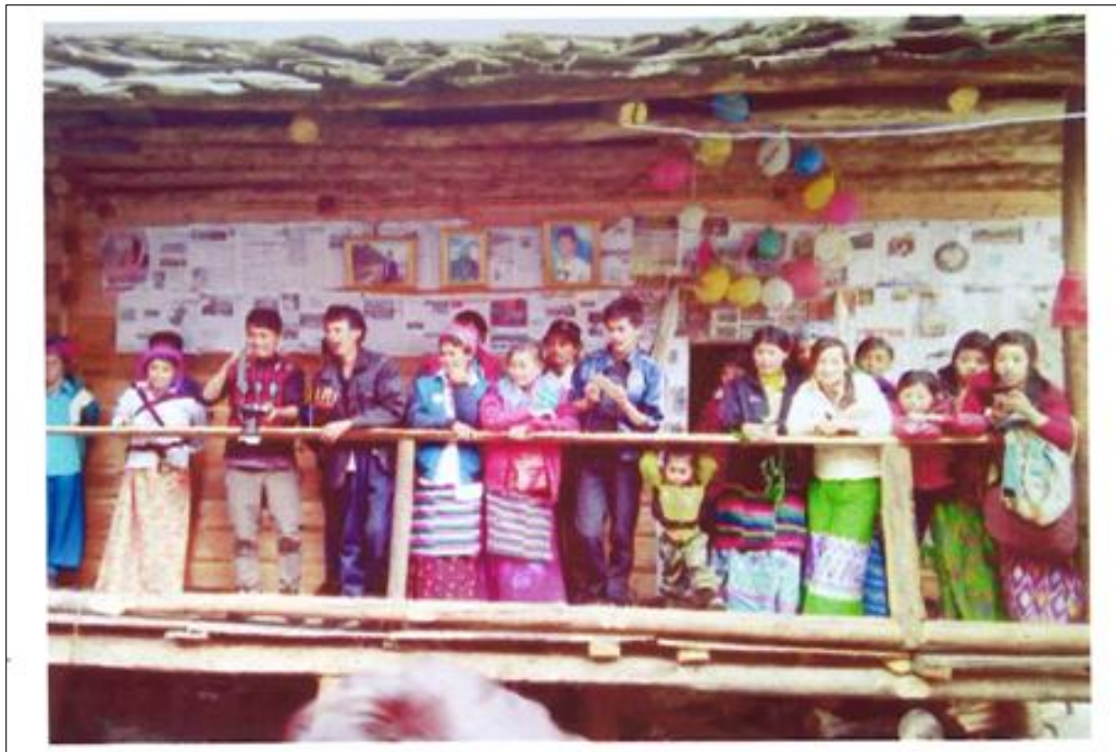
တိဗက်တိုင်းရင်းသားများ နေအိမ်နှင့် နွားနောက် မြင်ကွင်းပုံ (ဗ-၂)