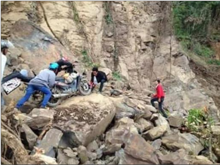
ဒေသခံများ ခက်ခဲစွာ ခရီးသွားလာနေရသော မြင်ကွင်းပုံ (၃-၂)