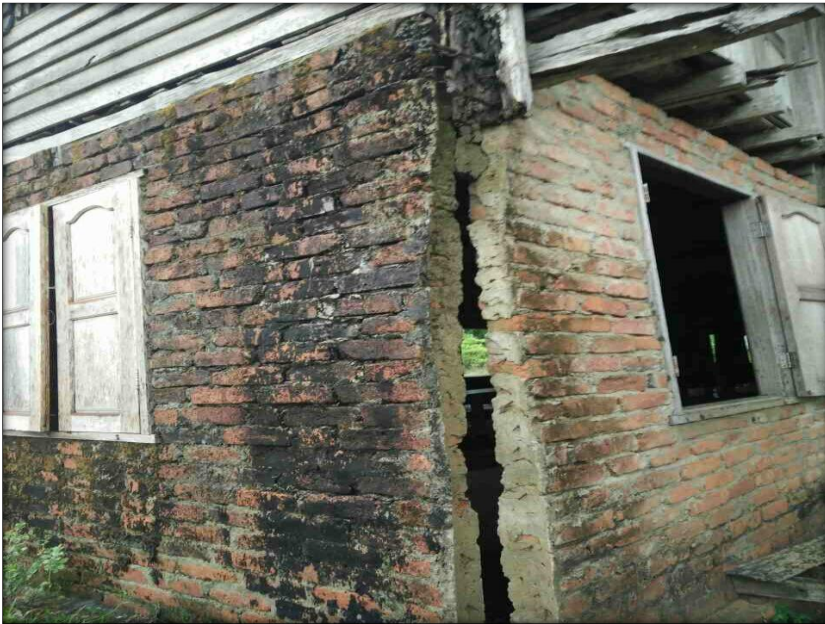
အန္တရာယ်ရှိကျောင်းဆောင် အခြေအနေမြင်ကွင်းပုံ (ဇ-၁)

အန္တရာယ်ရှိကျောင်းဆောင် အခြေအနေမြင်ကွင်းပုံ (ဇ)