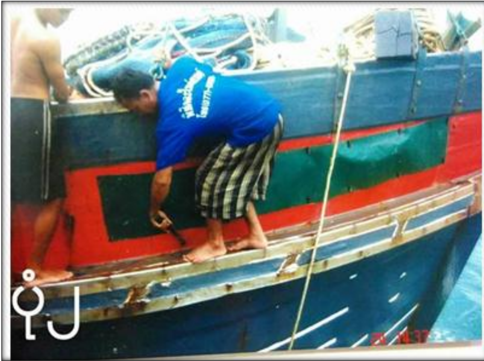
ကွန်ရက်ချိတ်ဆက် အလုပ်လုပ်ဆောင်ပုံ (ဌ-၂)

ကမ်းဝေးငါးဖမ်းရေယာဉ်မှ ကမ်းနီးငါးဖမ်းကွက်ထဲသို့ ဝင်ရောက် ငါးခိုးဖမ်းရန်အတွက် ရေယာဉ်နံပါတ်အား မမြင်အောင် ပိတ်နေသော မြင်ကွင်းပုံ (ဌ-၁)