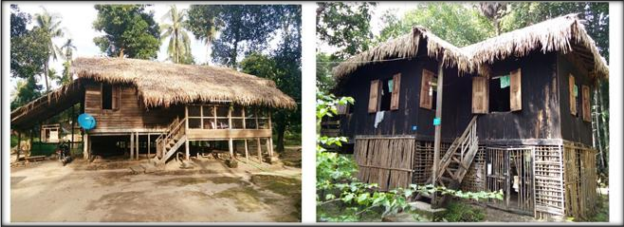
၁၉၆၂ ခုနှစ်မှစတင်ဆောက်လုပ်ခဲ့သည့် ဖက်မိုး၊ အုတ်ကြွပ်မိုး၊ ပျဉ်ခင်း၊ ပျဉ်ကာဖြင့် ယနေ့အချိန်အထိ ပြုပြင်နေထိုင်လျက်ရှိသည့် အဆောက်အအုံ မှတ်တမ်းဓာတ်ပုံ (က-၁)