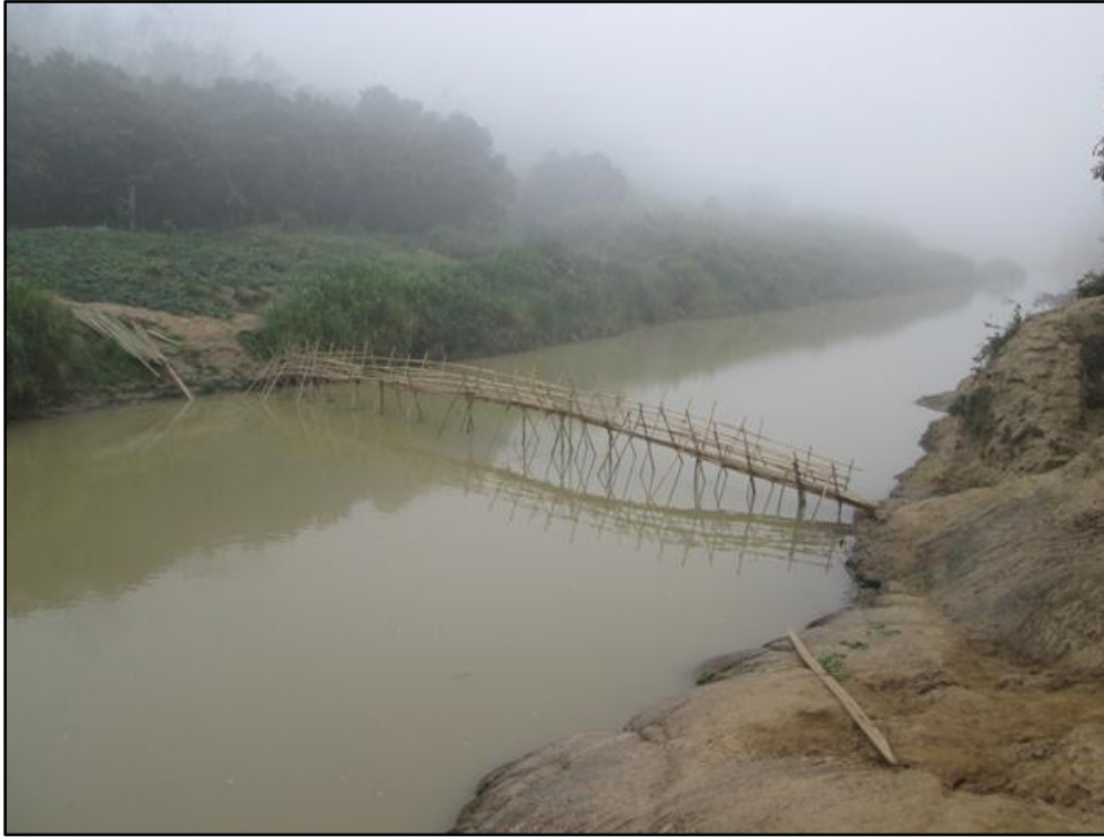
တံတားမြင်ကွင်းပုံ (၈၈-၁)

ကုလက်ချောင်းကူး ကိုယ်ထူကိုယ်ထ ဆောက်လုပ်ထားသော တံတားမြင်ကွင်းပုံ (၈၈)