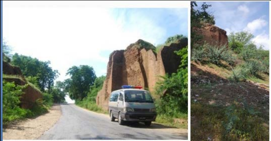
ပခန်းမြို့ရိုးမှ ဆန်းပြားသော အုတ်စီထားပုံ (၁-၁)

မြောက်ဘက်မြို့ရိုး၏ ဝင်းမနားတံခါးက အုတ်နံရံကြီးနှင့် တောထနေသော ကန္တာရ ထနောင်းပင်များပုံ(၁)