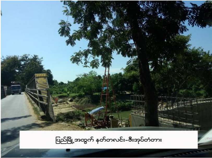
ပြည်မြို့အထွက် နတ်တလင်း-ဇီးအုပ်တံတား