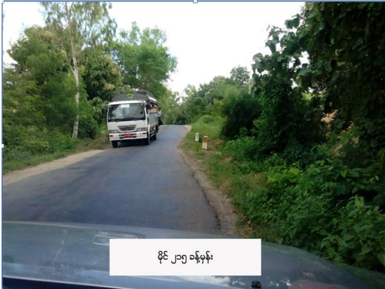
မိုင် ၂၁၅ ခန့်မှန်း မြင်ကွင်းပုံ (ဃ-၂)