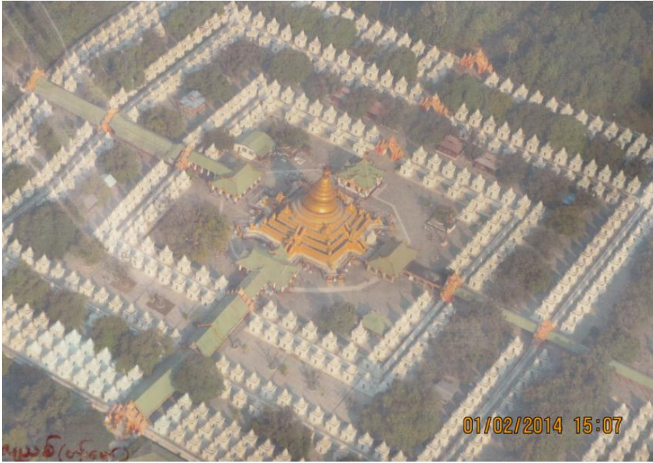
ခရပင်များ တည်ရှိသောနေရာအား ပြသထားသော မြင်ကွင်းပုံ(င-၁)