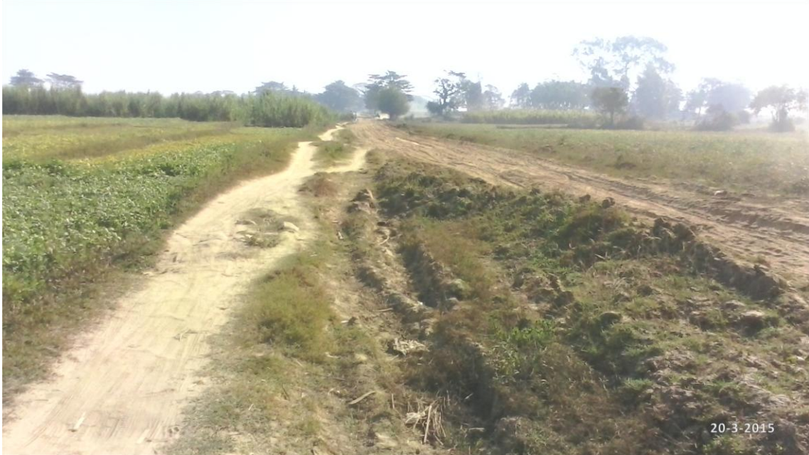
ဆင်တမော့ကျေးရွာ ရွာအဝင်မြေသားလမ်းပုံ (လ-၂)