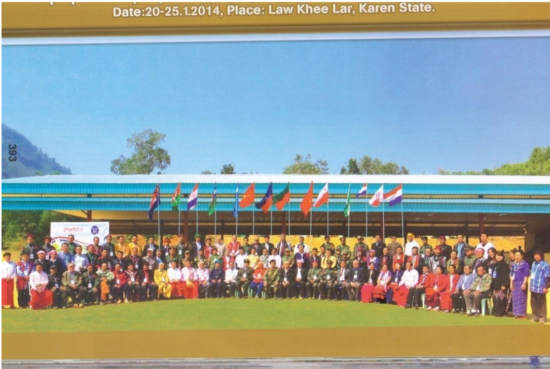
ပြည်ထောင်စုငြိမ်းချမ်းရေး ဖော်ဆောင်ရေးလုပ်ငန်းကော်မတီ၊ ဒု-ဥက္ကဋ္ဌ ဦးအောင်မင်းဦး ဦးဆောင်သော ကေအိုင်အို ဗဟိုငြိမ်းချမ်းရေး ဆွေးနွေးရေးအဖွဲ့တို့တွေ့ဆုံဆွေးနွေးပွဲအပြီး မှတ်တမ်းဓာတ်ပုံ (ဟ-၂)