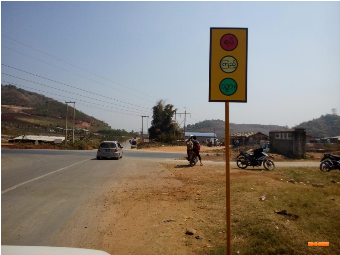
မန္တလေး-မူဆယ်နှင့် လားရှိုး-နမ္မတူသွား ကားလမ်းဆုံပုံ (၀)

ပါဝါပွိုင့်တစ်ခုနဲ့ တင်ပြပါရစေ။ ဒီအခုမြင်ရတဲ့ လမ်းမကြီးကတော့ ကျွန်တော်တို့ မန္တလေး- မူဆယ် ပြည်ထောင်စုလမ်းမ လာရှိုးမြို့ရှောင်လမ်း ဖြစ်ပါတယ်ခင်ဗျား။ ကန့်လန့်ဖြတ်ကတော့ ကျွန်တော် တို့ လာရှိုးမြို့နဲ့ ဒီ နမ္မတူမြို့ကို သွားတဲ့ လမ်းဆုံဖြစ်ပါတယ်ခင်ဗျား။ ဒီနေရာဆိုရင် အင်မတန်မှ အန္တရာယ် များပါတယ်ခင်ဗျား။ လက်ရှိအသုံးပြုနေတဲ့ မီးပွိုင့်လို့ခေါ်ရမလား၊ ဘာလားတော့မသိဘူး။ ဒီကောင်က တော့ ရပ်၊ ကြည့်၊ သွားပုံစံနဲ့ပဲ ဖြစ်နေပါတယ်။ ဒါက ယာဉ်လည်း အင်မတန်ရှုပ်ထွေးတဲ့ နေရာပါ။ တော်တော်လေး ကျွန်တော်တို့ မြို့မှာ ဒီလိုမျိုးယာဉ်အန္တရာယ်ရှုပ်ထွေးပြီးတော့ သွားလာတဲ့နေရာတွေ တော်တော်များများ ရှိပါတယ် ခင်ဗျား။ ဒါကြောင့်မို့ ဒီမီးပွိုင့်ကိုထပ်တိုးပြီးတော့ အန္တရာယ်ရှိတဲ့နေရာမှာ တပ်ဆင်သွားမယ် ဆိုရင်တော့ ကောင်းမွန်မယ်လို့ ကျွန်တော်ထင်မြင်ယူဆပါတယ်ခင်ဗျား။ ဒါကြောင့်မို့ ကျွန်တော်မေးမြန်းလိုတဲ့ မေးခွန်းကတော့ လားရှိုးမြို့နယ် အချက်ပြသတိပေး မီးပွိုင့်များ ထပ်မံတိုးချဲ့ တပ်ဆင်ရန် အစီအစဉ် ရှိ/မရှိသိရှိလိုပါတယ်။ လက်ရှိအသုံးပြုတပ်ဆင်ထားတဲ့ မီးပွိုင့်(၄)ခုအနက် ပျက်စီးနေသော မီးပွိုင့်(၃)ခုအား အမြန်ဆုံးပြန်လည် ပြုပြင်ထိန်းသိမ်းသွားရန် အစီအစဉ်ရှိ/မရှိသိရှိ လိုပါတယ် ခင်ဗျား။ ကျေးဇူးတင်ပါတယ်။