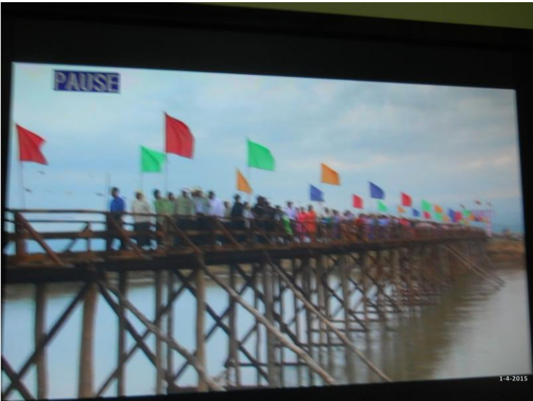
မန်နောင်တံတားဖွင့်ပွဲသို့ တက်ရောက်လာသော ဒေသခံများပွဲ (၉၉-၁)