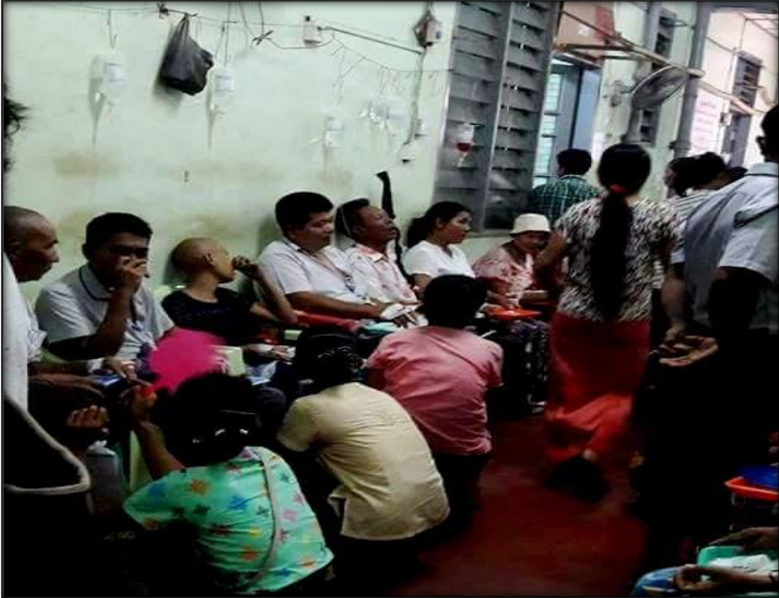
လူနာစောင့်ထိုင်ခုံတွင် အဆင်ပြေသလို သွေးသွင်းနေကြရသော ကင်ဆာဝေဒနာရှင်များမြင်ကွင်းပုံ(တတ-၁)

သီးသန့်နေရာမရှိသဖြင့် ဖြစ်သလိုဆေးသွင်းနေရသော ကင်ဆာဝေဒနာရှင်များမြင်ကွင်းပုံ (တတ)