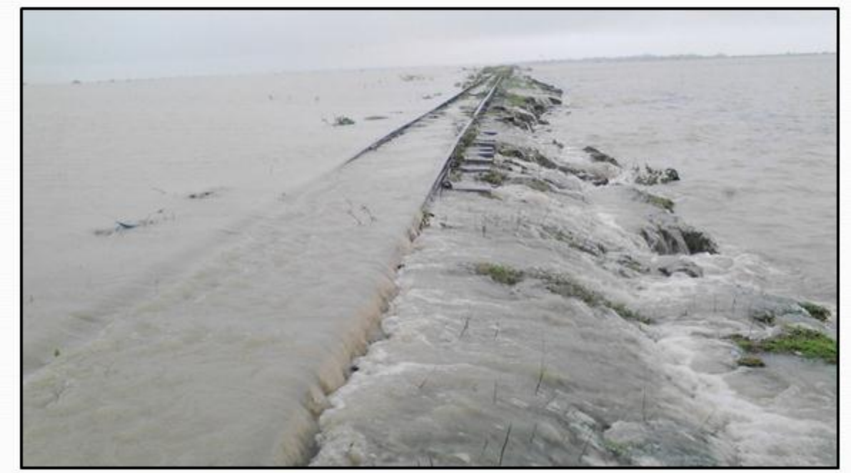
အပေါက်ဝဘူတာ နှင့် ကျောက်တော်ဘူတာကြား ရထားလမ်းတာဘောင် ရေကျော်မှု အခြေအနေ (၈)

အပြာရောင်လေး ဖြစ်ပါတယ်။ အခုအနီ dot dot dot ပြထားတာသည် ကျွန်တော်တို့ ရှောင်ရမယ့် နေရာပေါ့။ ရှောင်ရမယ့်နေရာ အဓိက(၃)နေရာကို ညာဘက်အခြမ်းမှာ ဖော်ပြထားပါတယ်။ အပေါ်မှာ ကတော့ ကျောက်တော်နားမှာ ဖြစ်ပါတယ်။ အမှန်ကတော့ ဝေသာလီဘူတာနားမှာဖြစ်ပါတယ်။ နောက် မြောက်ဦးဘူတာနားမှာ ဖြစ်ပါတယ်။ အဲဒီအခါမှာ ခုနတုန်းက လူနေရပ်ကွက်တွေနဲ့ ဝေးတဲ့နေရာ တွေလည်း ဖြစ်သွားနိုင်ပါတယ်။ ဒီနေရာမှာ အားလုံး ရှေးဟောင်းယဉ်ကျေးမှုနယ်မြေရှောင်ကွင်းလမ်း အား ထပ်မံရှာဖွေခဲ့သော်လည်းပဲ ယခုအချိန်ထိ ဒေသခံပြည်သူတွေရဲ့ သဘောတူညီမှုမရရှိသေးတဲ့ အတွက်ကြောင့် ကျောက်တော်-မြောက်ဦးလမ်းပိုင်းဟာ ဆက်လက်အကောင်အထည်ဖော်နိုင်ခြင်း မရှိ သေးပါဘူး။ ဒေသခံပြည်သူများရဲ့ သဘောထားတူညီချက် ရရှိပြီးပြီ။ အားလုံးကျေနပ်သဘောတူကြပြီး ပြီဆိုရင် ၂၀၁၇-၂၀၁၈ ဘတ်ဂျက်မှာ နိုင်ငံတော်ကို ဘဏ္ဍာငွေ တင်ပြတောင်းခံပြီးတော့ ခွင့်ပြုချက် ရရှိပါက ဆက်လက်ပြီးတော့ အကောင်အထည်ဖော် ဆောင်ရွက်သွားမည်ဖြစ်တဲ့အကြောင်း ရှင်းလင်း ဖြေကြားအပ်ပါတယ်။ အားလုံးကျေးဇူးတင်ပါတယ်။ (ဩဘာသံများ)