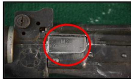
KO-11 အမျိုးအစား သေနတ်