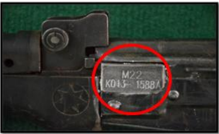
KO-13 အမျိုးအစား သေနတ်