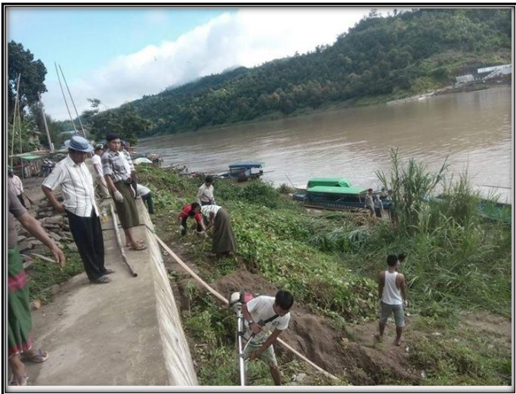
မြေသားလမ်း ပြိုကျခြင်း မြင်ကွင်းပုံ (၄-၁)

ပလက်ဝမြို့ ကမ်းနားလမ်း မြေထိန်းနံရံ မြင်ကွင်းပုံ (၅)