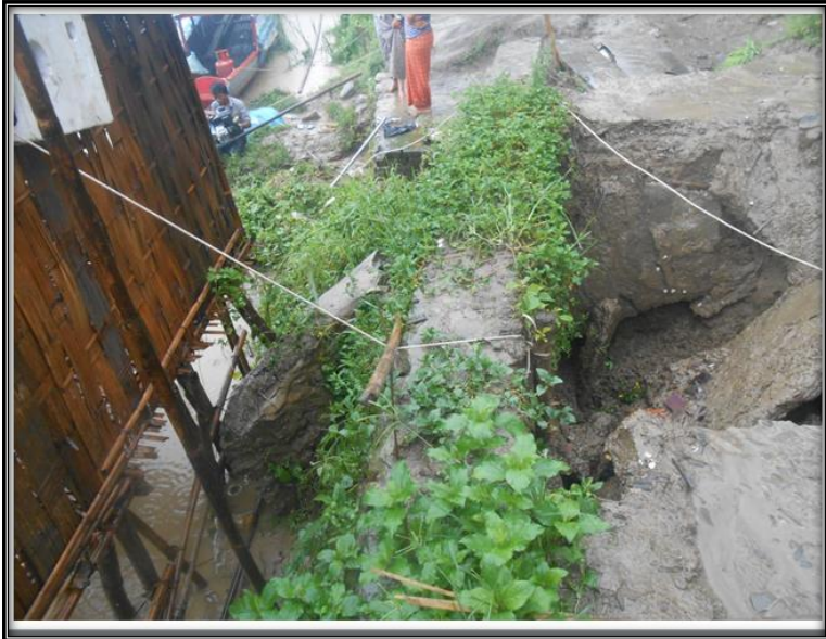
မြစ်ရေကြီးမှုကြောင့် မြေထိန်းနံရံနှင့် ကွန်ကရစ်လမ်းခင်းရန် လိုအပ်ခြင်း မြင်ကွင်းပုံ (၄-၂)