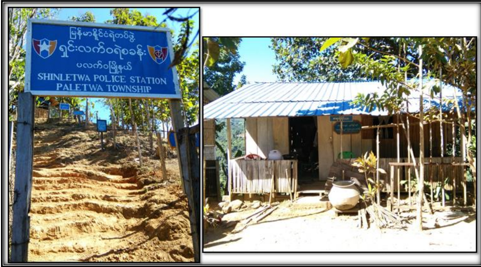
အလေးပြူအဆောက်အဦနှင့် ကင်းစောင့်ရုံ၏ မြင်ကွင်းပုံ (၅-၁)