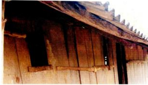
ပန်ဝိုင်မြို့နယ် ၊ စီကန်လိုက်ကျေးရွာအုပ်စု ၊ လာကိုင်းကျေးရွာရှိ အ.မ.က ကျောင်းမြင်ကွင်းပုံ

ပန်ဝိုင်မြို့နယ်၊ စီကန်လိုက်ကျေးရွာအုပ်စု၊ လာကိုင်းကျေးရွာရှိ အ.မ.က ကျောင်းမြင်ကွင်းပုံ(ဗဗ)