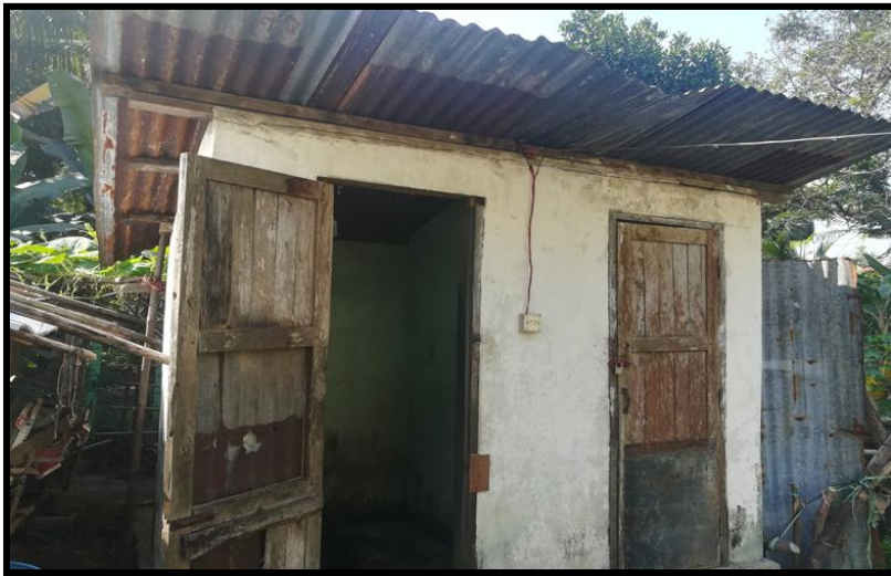
အားကစားခန်းမ နောက်ဘက်ရှိ ဝန်ထမ်းအိမ်ရာ မြင်ကွင်းပုံ (ခ-၂)