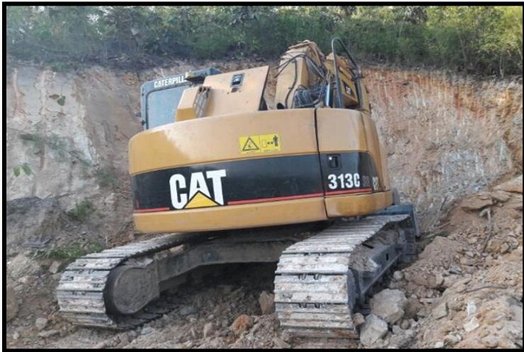
တောင်ဝိုင်းတောင်အား ဖြိုထားသည့်အနေအထား မြင်ကွင်းပုံ (ဈ-၂)