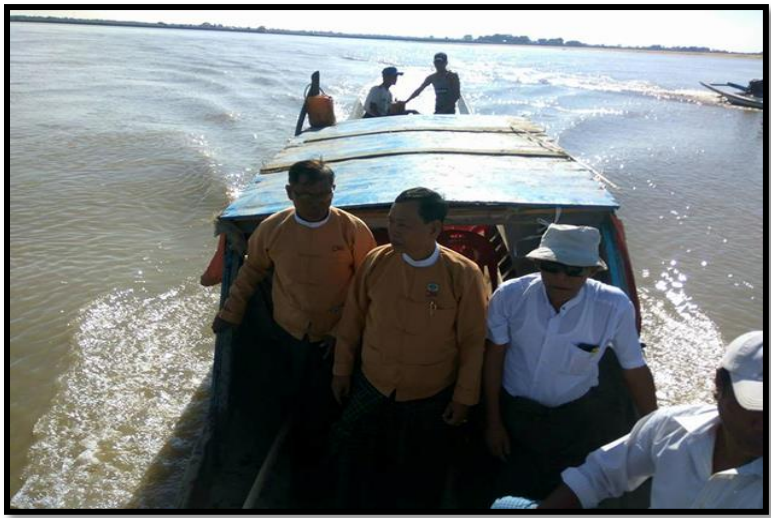
ကမ်းပြိုနေသည့် နေရာများ မြင်ကွင်းပုံ (၈-၁)

လွှတ်တော်ကိုယ်စားလှယ် ကိုယ်တိုင် လိုက်လံစစ်ဆေးသည့် မှတ်တမ်းဓာတ်ပုံ ပြပုံ (၈)