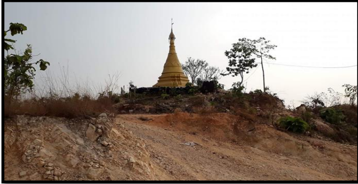
တောင်ဝိုင်းတောင်အား ခါးလယ်မှ စက်ဖြင့် ဖြိုနေသည့် မြင်ကွင်းပုံ (ဈ-၁)

တောင်ဝိုင်း တောင်ပေါ်တွင် တည်ရှိသော ရှေးဟောင်း ရွှေကြက်ကျဘုရား မြင်ကွင်းပုံ (ဈ)